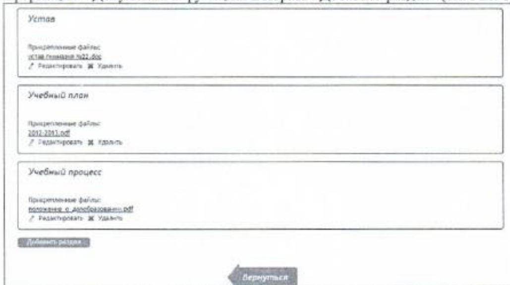
Рис. 1. Добавление нового раздела.

1. На странице школы перейти в Редактировать данные – Общая информация – Документы и функции. Выбрать «Добавить раздел» (см. Рис. 1)